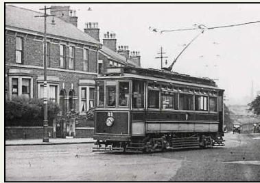
b. Met de tram