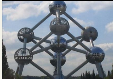
b. De atomium