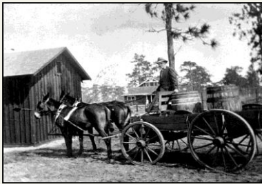
a. Met paard en wagen