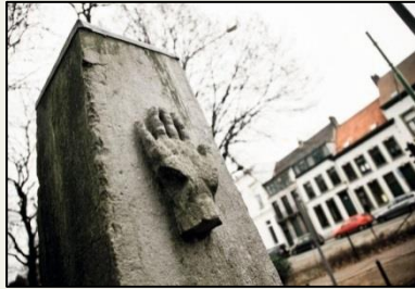
a. De Hand

7. Wat is het symbool dat De Koninck en de stad Antwerpen gemeen hebben?