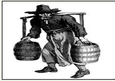
d. Te voet met een draagstuk